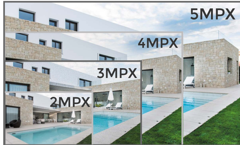
*Referencia de Imagen