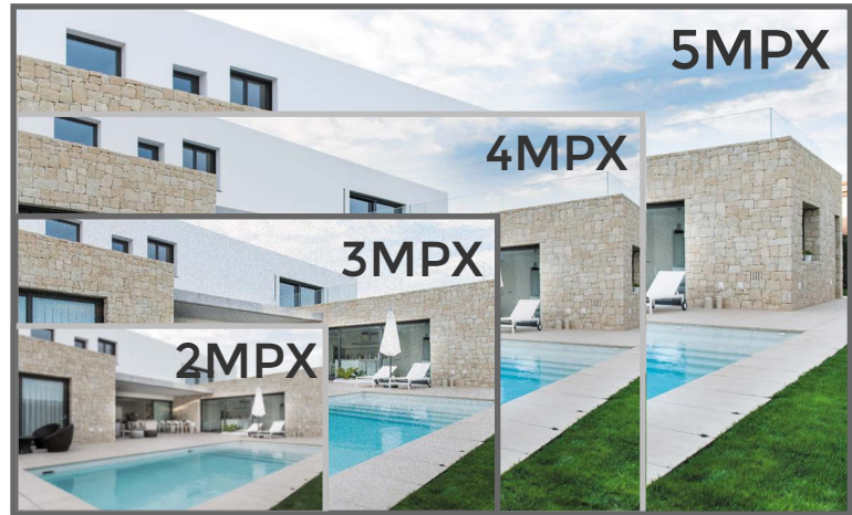
*Referencia de Imagen